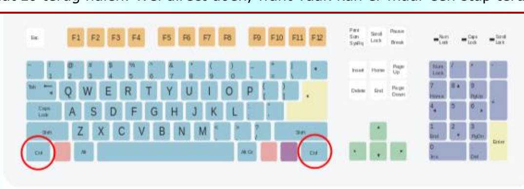
De positie van de Ctrl-toets op een standaard internationaal toetsenbord.

Wat als je 'n fout maakt, onbedoeld iets heel anders dan je van plan was? Geen nood: met Ctrl-Z wordt direct de voorige situatie hersteld . Dezelfde herstellfunctie werkt ook in foto- of videobewerkingssoftware. Zelfs als je per ongeluk een bestand weggooit kun je dat zo terug halen. Wel direct doen, want vaak kan er maar één stap terug.