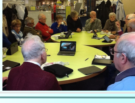
Tablet Café vorig jaar Gezellige drukte

Deze gratis inloopmiddag is een gezellig samenzijn voor deskundigen en leken. Kom langs en laat u verrassen: enthousiaste tabletgebruikers leren u graag wat handigheidjes. Bent u zelf handig met een tablet en wilt u uw kennis delen, kom dan ook langs. Het kopje koffie of thee staat voor u klaar! Net als in een regulier café kan iedereen gewoon binnenlopen en is er wat te drinken.